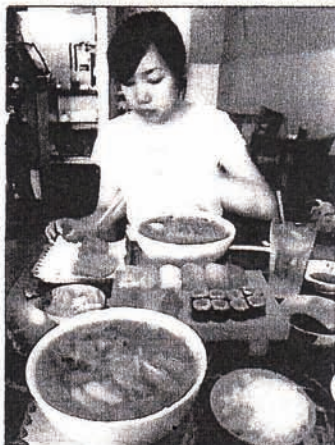
はちいっぱいラーメン

カルフォルニア州マーセッド市での小さなレストラン。寿司だけでなくラーメンも食べられる。あまり期待しないで寿司を注文しましたが、出てきた寿司は、とても見栄えよく、日本の寿司となんら変わらないと思いました。食べてみますと本当に美味しかったですね。