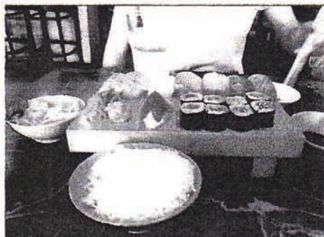
ボリュームある本格的な寿司