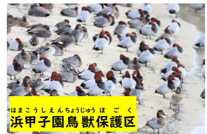
はまこうしえんちようじゅうほごく 浜甲子園鳥獣保護区