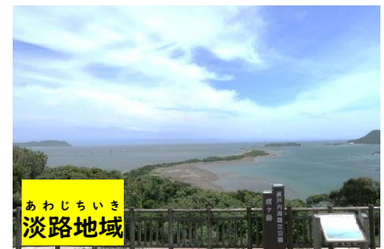
あわじちいき 淡路地域