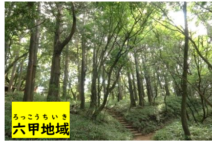
ろっこうちいき 六甲地域