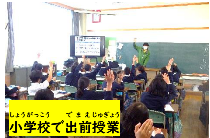
小学校で出前授業