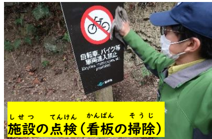
施設の点検（看板の掃除）

私たちは、国立公園を訪れる人が、安全に自然を楽しめるように施設の整備や管理をしたり、貴重な動植物の保全や、自然を楽しめる観察会のイベント等を行っています。国立公園のなかだけではなく、学校等に向いて、国立公園や自然に関する出前授業を行うこともあります。