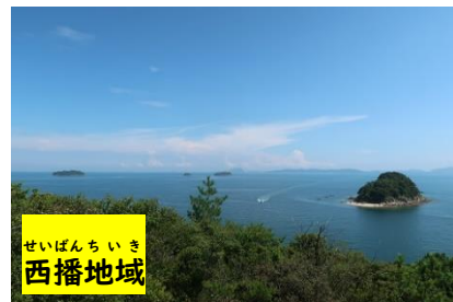
せいばんちいき 西播地域