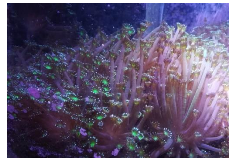
館内で飼育されているニホンアワサンゴ