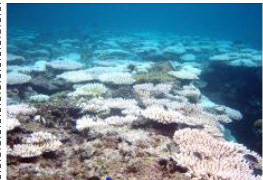
環境省も、白化現象の原因を探る調査を行っています。

写真のようにサンゴが白く見える状態は、サンゴの体内にもともといた褐虫藻がいなくなって、白い骨格が透けて見えている状態で、 白化 と言います。このままの状態が1か月ほど続いたら、サンゴは死んでしまうといわれています。白化の原因は様々あると言われていて、影響があるのは、30℃を越す高い海水温や強すぎる太陽の光をあびることによるストレスだと考えられています。