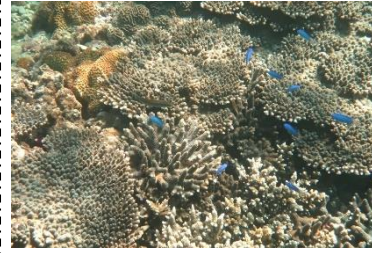
きれいなサンゴ (和歌山県串本)

うみ なか 海の中にあるサンゴを見たことはありますか？ごつごつして、岩のように見えたり、はたまた枝分かれして色鮮やかな植物のように見えますが実はサンゴはクラゲやイソギンチャクの仲間、れっきとした動物です。今回はそんなサンゴについて、紹介します。