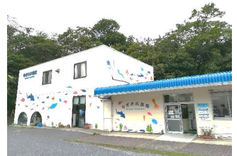
山口県周防大島のなぎさ水族館

環境省ではその群生地を守るため、2013年2月に国立公園の海域 公園地区に指定しサンゴの保護に努めています。ニホンアワサンゴ は、山口県周防大島町にあるなぎさ水族館でも見ることができ ので、ぜひ訪れてみてくださいね。