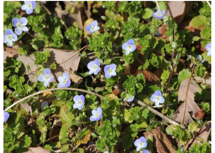
【スマレ】 日当たりのよい道端や草地に咲く