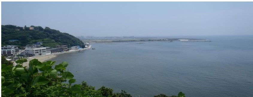
まんちょうじ (満潮時) 兵庫県たつの市 新舞子浜