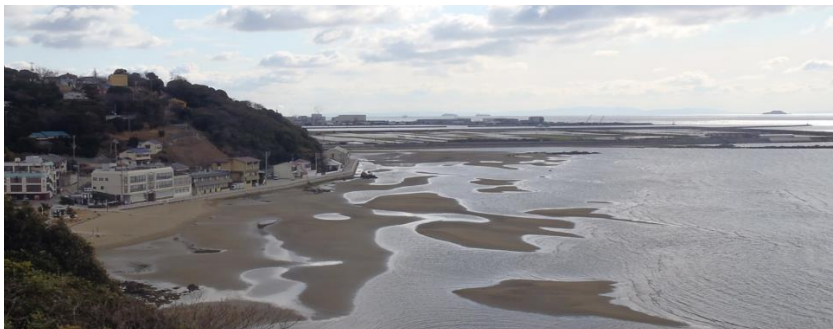
かんちょうじ (干潮時) ↑ ひろ ひがた で 広い干潟が出てきています

1日のうちに満潮と干潮が2回ずつやってきます。満潮から次の満潮まで約12時間50分かかり、日によって満潮・干潮の時刻が異なります。